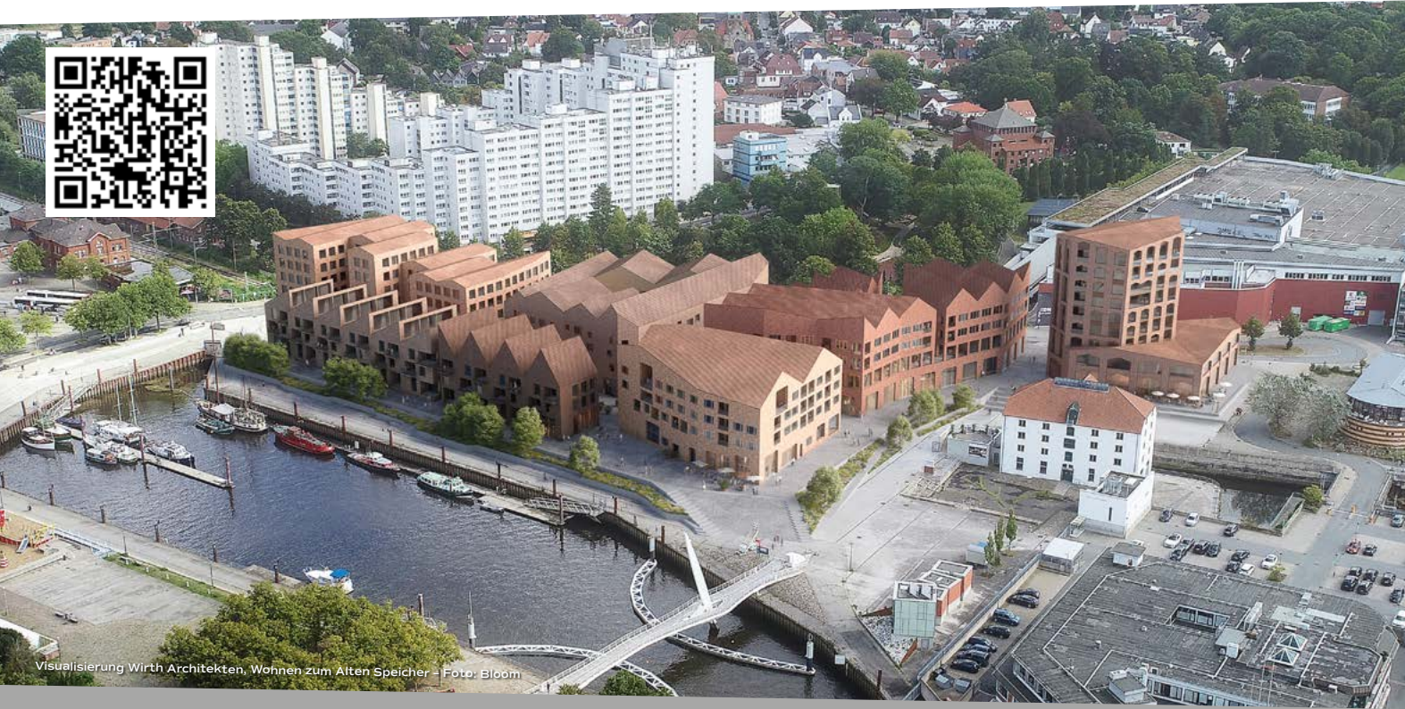
Visualisierung Wirth Architekten, Wohnen zum Alten Speicher