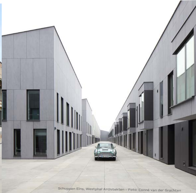
Schuppen Eins, Westphal Architekten