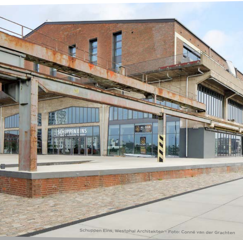
Schuppen Eins, Westphal Architekten

LOCATION: SCHUPPEN EINS, KONSUL-SMIDT-STRASSE 22, 28217 BREMEN BEGINN: 17:45 UHR